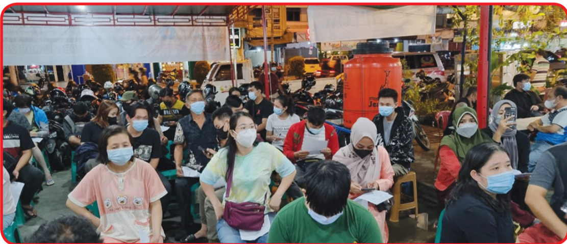
Warga yang akan divaksinasi Covid-19 di kantor sekretariat Yayasan Bhakti Suci pada Selasa (2/11) malam.