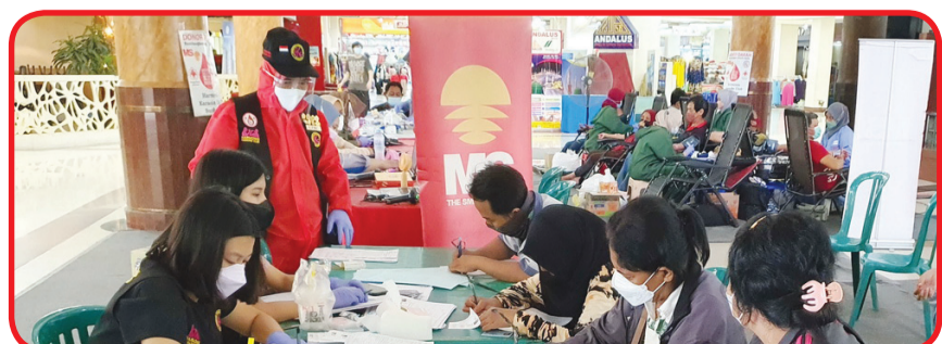
Petugas melayani pendaftaran dan pemeriksaan Kesehatan warga yang ingin peserta donor darah.

Penyerahan paket sembako untuk peserta donor darah.