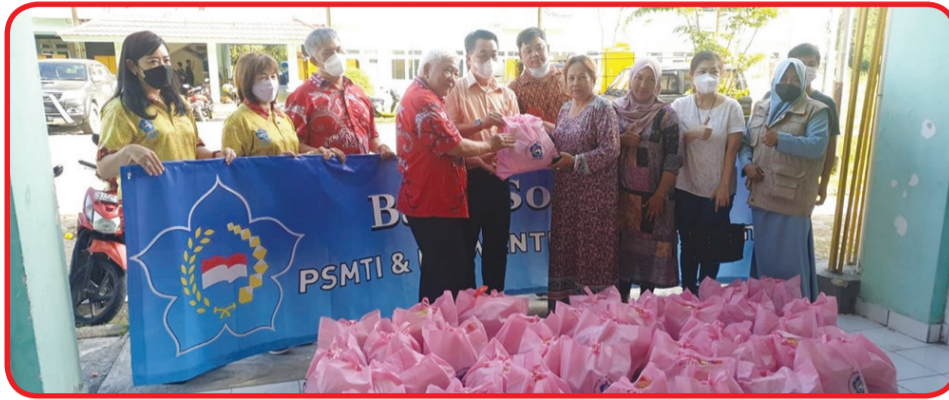
Pengurus PSMTI Tarakan menyerahkan paket sembako kepada warga korban kebakaran di Kelurahan Sebengkok.

Pada kepengurusan sebelumnya PSMTI Tarakan juga rutin memberikan bantuan jika terdapat musibah yang merugikan warga.