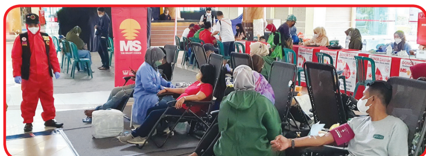
Suasana pelaksanaan donor darah yang berlangsung lancar.