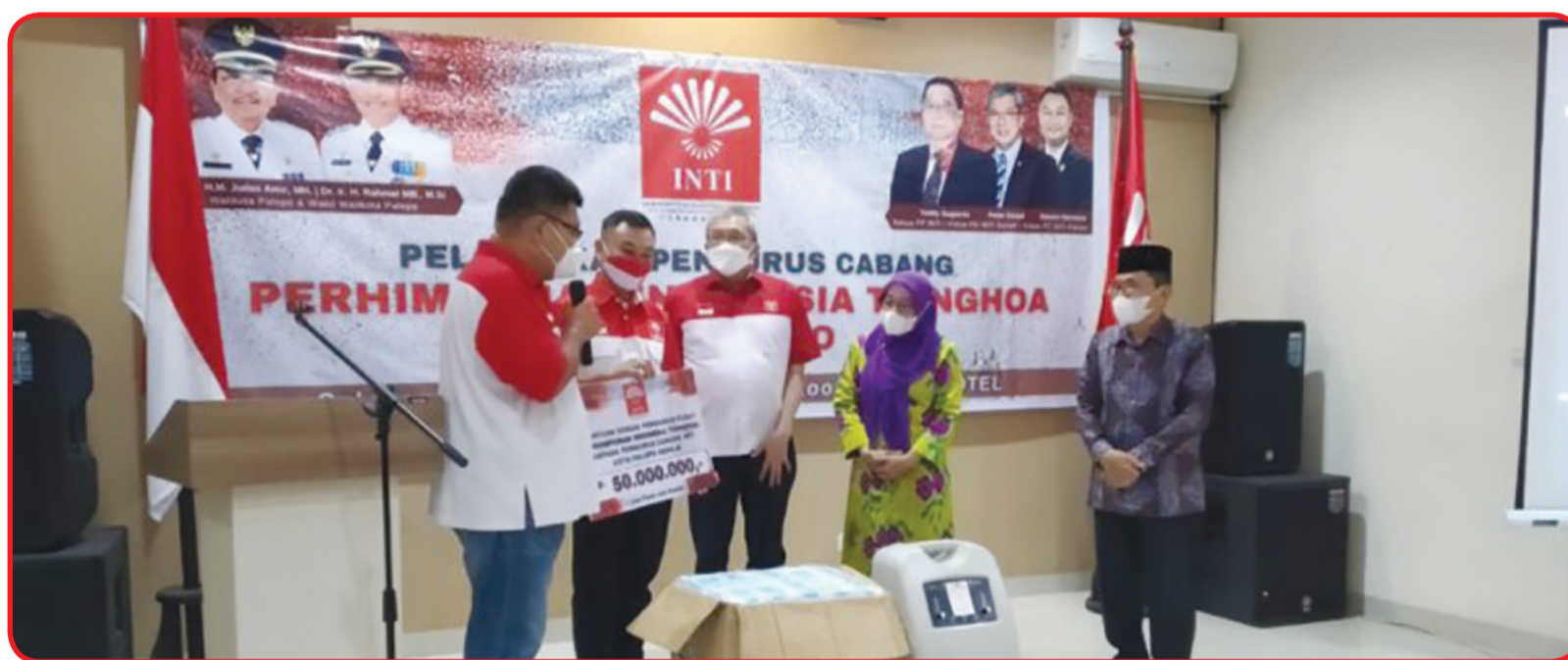
Pengurus Perhimpunan INTI Sulsel menyerahkan bantuan kepada Pengurus INTI Kota Palopo untuk disalurkan ke warga terdampak bencana.

"Kita tidak bisa memilih dilahirkan dari suku, agama, orang tua mana. Itu semua takdir dari Tuhan. Tapi yang pasti kami adalah bagian