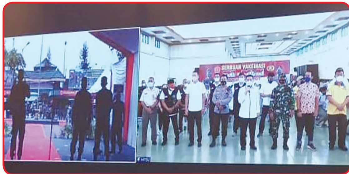
Video conference vaksinasi yang diselenggarakan Perhimpunan MITSU di Lapangan Benteng.

MEDAN (IM) - Saat ini, seiring dengan semakin banyak orang yang divaksinasi, kondisi pandemi Covid-19 di Indonesia secara berangsur menurun. Menurut laporan data terbaru dari Dinas Kesehatan Sumatera Utara, hingga saat ini tingkat vaksinasi di Sumatera Utara sudah 45%.